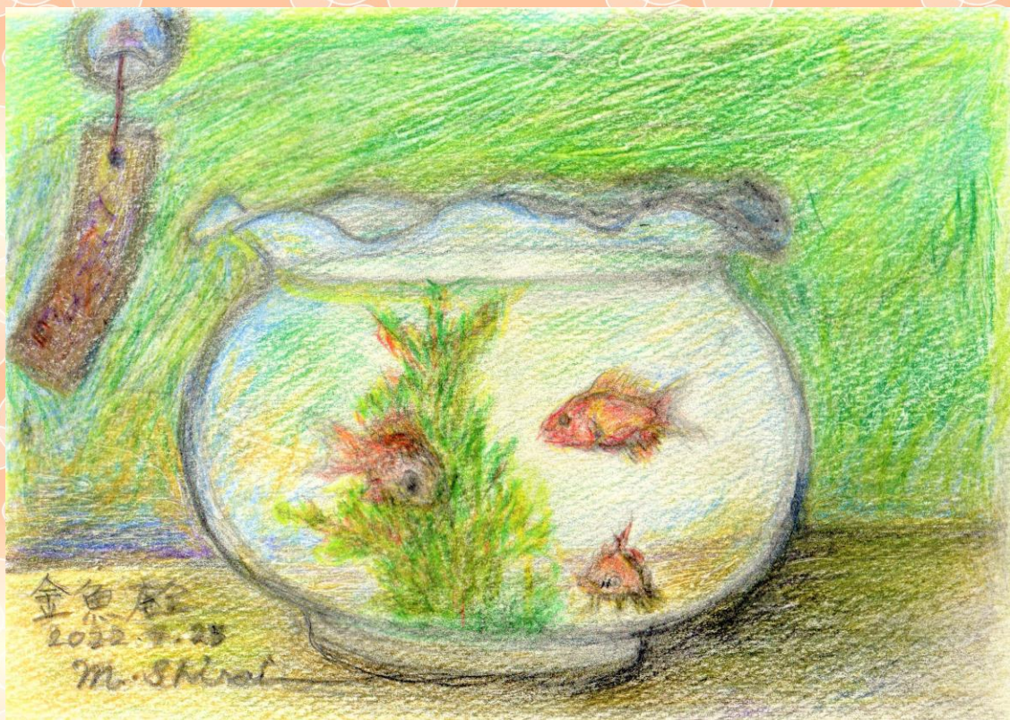
特養 白井 正敏 様の作品「金魚鉢」

住所 東京都武蔵村山市伊奈平6丁目14番の2 電話 042-560-3916 URL http://www.inadairaen.com mail info@inadairaen.com 編集・発行 社会福祉法人村山福祉会 編集係