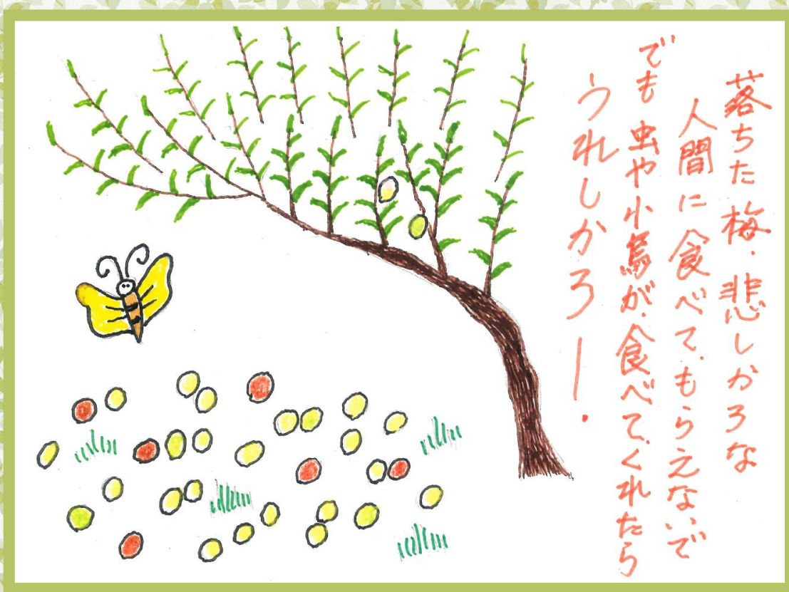
特養 柳原 フミエ 様の作品「梅の哲学」

住所 東京都武蔵村山市伊奈平6丁目14番の2 電話 042-560-3916 URL http://www.inadairaen.com mail info@inadairaen.com 編集・発行 社会福祉法人村山福祉会 編集係